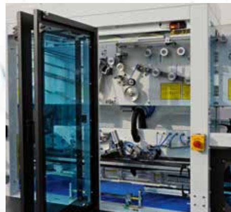
Einfach zugänglich durch Fenster - Türen, die geöffnet werden können.