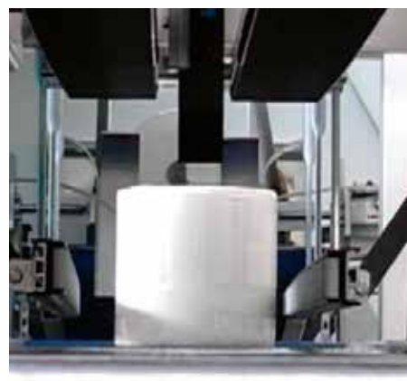
Hohe Geschwindigkeit. Bis zu 80 Takte/min, einfacher Formatwechsel.