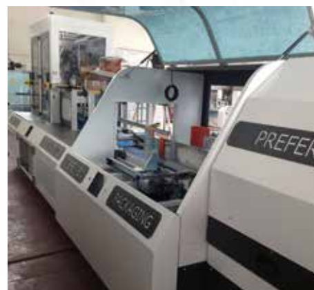
Integrierbar in unsere Verpackungslinien.