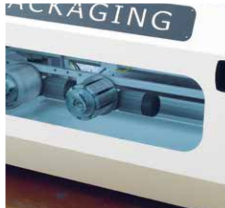
Zweifache Spendereinheit für Kartonrollen; Sonderausstattung: Tragegriffrollen.