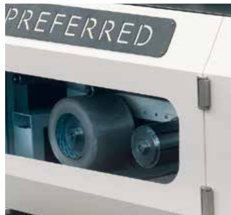
Zweifache Spendereinheit für Klebebänder.