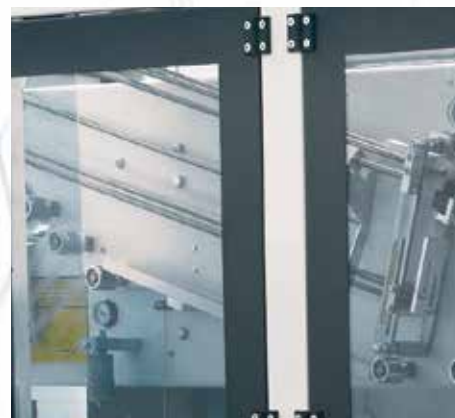
Vorrichtung zum Vorschneiden von Karton und Kartonaufbewahrung.