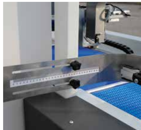
Schneller Formatwechsel, Größen an metrischer Skala angegeben.